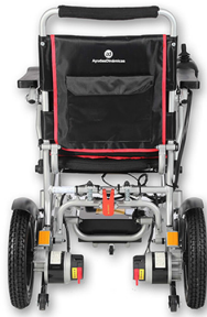
SUPER ESTRECHA 60 CM

Equipada con una batería de Litio de 20Ah con una autonomía aproximada de 20km. La batería es extraíble y permite la carga fuera de la silla. También incorpora un cargador para realizar la carga directamente al Joystick/mando. Con dos motores brushless (sin escobillas) de 250W. Ofrecen mayor rendimiento y vida útil.