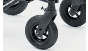
812 Direccionadores ruedas delanteras