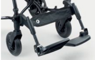
956 Plataformas con regulación de la inclinación