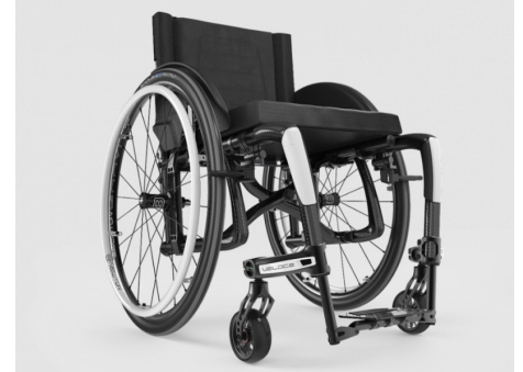
CHASIS ACABADO CARBONO CON DETALLES DE COLORES