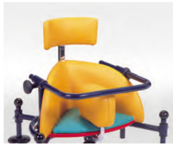
860 - apoyacabeza cóncavo regulable en altura