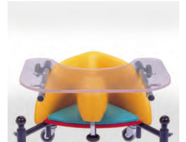
824 - mesa transparente con hueco