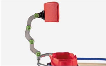
ACCESORIO OPCIONAL 865 Reposacabezas multirregulable altura, inclinación y adelante atrás ajuste con pomos.