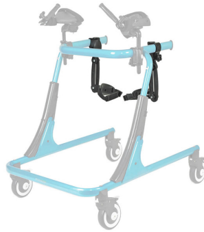
Sujeción de pierna Ref.: TK 1090S - TK1090L