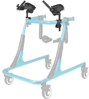
Soportes de antebrazo Ref.: TK 1035S - TK 1035L