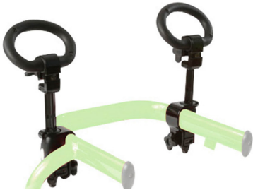
Asas para las manos Ref.: TK 1010