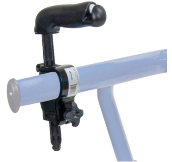
Empuñaduras Ref.: TK 1045