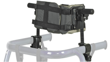
Soporte de tronco Ref.: TK 1080S, TK 1080M, TK 1080L