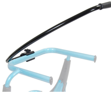
Maneta de empuje Ref.: TK 1020