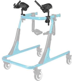
Soportes de antebrazo Ref.: TK 1035S - TK 1035L