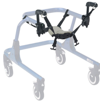
Posicionador de cadera Ref.: TK 1070S - TK 1070L

Ref.: Para modelo TK 1060S ... TK 1000 TK 1060M ... TK 2000 TK 1060L .... TK 3000