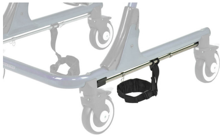
Sujeción de tobillos Ref.: Para modelo TK 1060S ... TK 1000 TK 1060M ... TK 2000 TK 1060L .... TK 3000