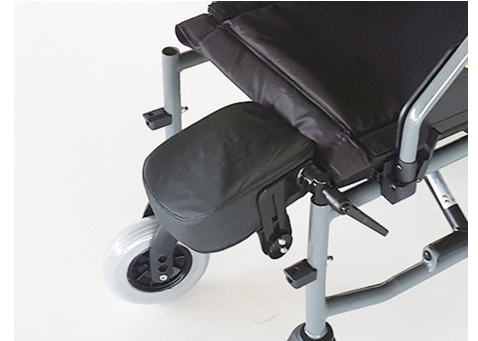
Soporte para amputados. Derecho (REF.AGR3) Izquierdo (REF.AGR4)