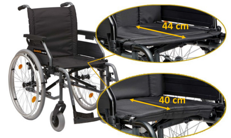
DOS PROFUNDIDADES DE ASIENTO

El anclaje posterior es regulable en 3 posiciones (46 / 48,5 / 51 cm) para escoger la altura del asiento para cada usuario. También permite retrasar el centro de gravedad de la silla, lo que la hace más estable. Ideal para personas amputadas.