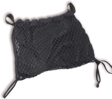
Bolsa para el respaldo (REF.H8660)