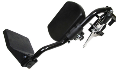
Reposapiés elevables. Derecho (REF.AGR1) Izquierdo (REF.AGR2)