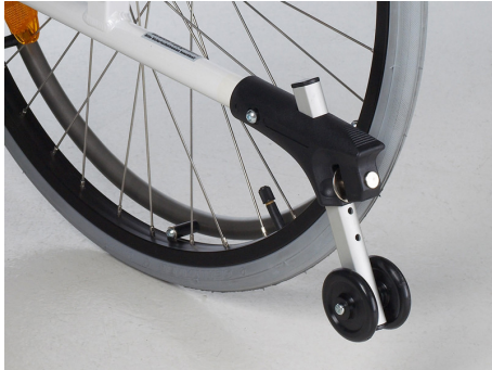
Ruedas antivuelco (REF.402584)