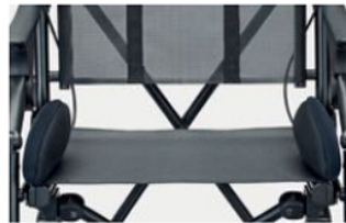
958 Soportes laterales pélvicos alchochados No disponible para Troli T60 con Autoimpulso.