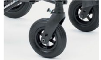
812 Direccionadores ruedas delanteras