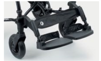
960 Soportes para talones