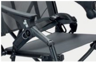
947 Cinturón pélvico de ángulo regulable variable Disponible en dos medidas