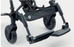
956 Plataformas con regulación de la inclinación