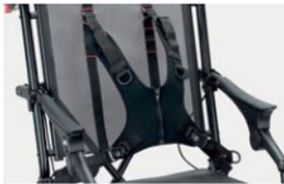
853 Pechera de tiradores con cremallera