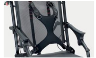
853 slim Pechera moldeada de cuatro puntos