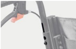
951 Manijas de empuje regulables en altura. Aumenta la altura máxima de 7 cm (98-105 cm).