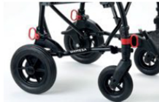
891 Anclaje (4 anillos) para el transporte, en dirección del sentido de marcha, en vehículos homologados en movimiento (coche, bus, etc.) Consulte el manual de uso y mantenimiento suministrado con la ayuda.