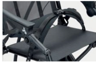
920 Cinturón pélvico de cuatro puntos Disponible en dos medidas