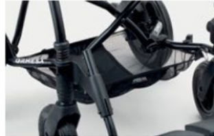
858 Cesta portaobjetos