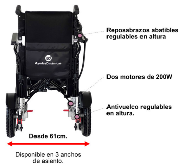
Tabla de medidas y modelos