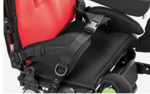
920 cinturón pélvico de cuatro puntos

Disponible en tres tamaños, proporcionado como estándar.