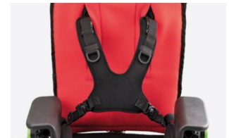
853 Arnés tipo chaleco