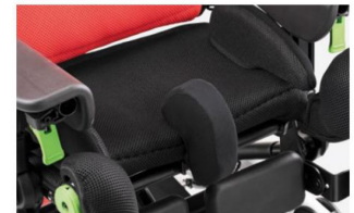
834N Bloque de abducción estrecho Regulable en profundidad junto con el asiento. Disponible en dos tamaños.