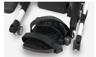
962 Reposapiés + Taloneras