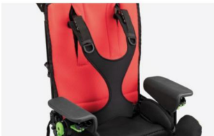
853 delgado Arnés en forma de cuatro puntos