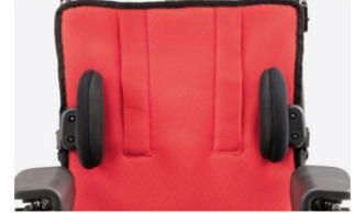
838 Soportes laterales de maletero

Regulables en altura, anchura y giro. Disponible en tres tamaños.