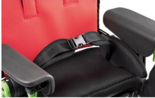
947 Cinturón pélvico con ángulo variable

Disponible en tres tamaños, proporcionado como estándar.