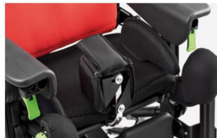
834R Bloque de abducción regulable en profundidad y abducción. Disponible en dos tamaños.