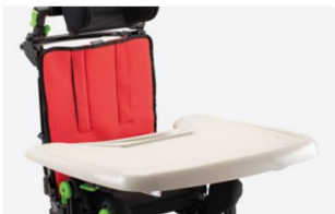
824 Bandeja con envoltorio receso

Regulable en profundidad, altura e inclinación con reposabrazos