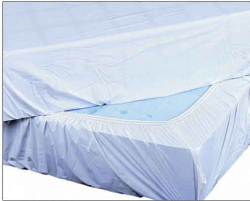
Sábana de cama ajustable PUR POLYFILM

-Una cubierta hipoalergénica de poliuretano transpirable e hiperextensible.