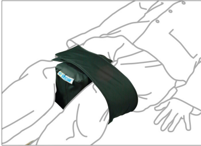
EN LA POSICIÓN SUPINA